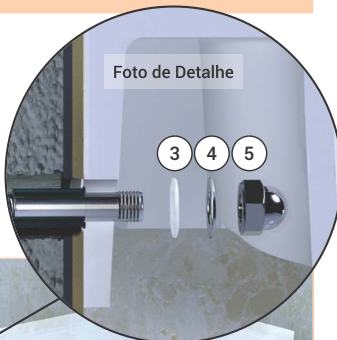
Foto de Detalhe

Insira a bucha (item 1) do seu kit de instalação que acompanha o produto e em seguida insira o parafuso (item 2) deixando 4 cm para fora da parede para a fixação do lavatório.